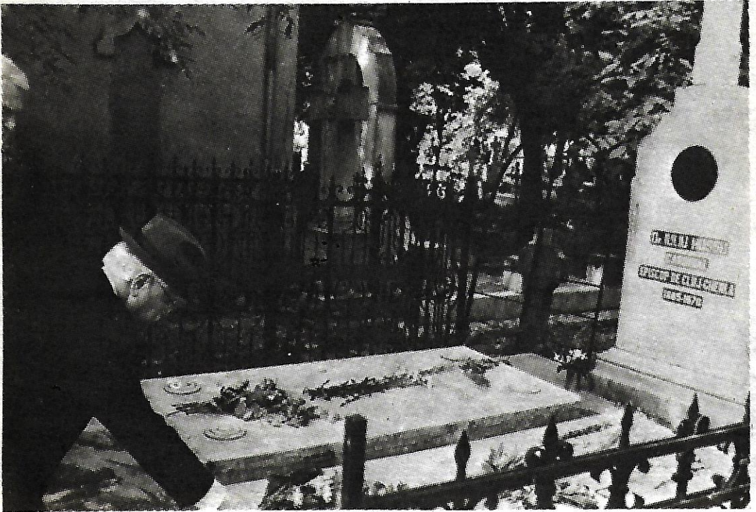
La București, la mormîntul dr. Iuliu Hossu

gat: că atunci când lumea europea insensibilă spectacolul nimicirii evreilor europeni, România a fost dispusă să primească refugiați evrei și a fost gata să deschidă, pentru salvarea lor, porturile țării. Era un drum bine știut de toată evreimea, dar, din nefericire, foarte mulți n-au mai apucat să-l facă. Au fost omorâți în mod bestial. Eu n-am bănuț măcar că se poate ajunge la o asemenea bestialitate! Credeam, dimpotrivă, că cea mai importantă realizare a omenirii e cultura, aveam un mare respect pentru patria lui Goethe, a lui Schiller, a atîtor titani pe care i-a dat Germania culturii universale. Mă întreab și azi la o viață de om de-atunci, cum a fost totuși posibil să se ajungă aici, în plin secol XX? E o întrebare care mă obsedează. A fost o tragedie a omenirii. O mare tragedie a secolului XX. O tragedie în care din România au răzbătut totuși, în suferințele celor aflați atunci în mare primejdie, raze de speranță - S-a scris istoria acelor zile, luni și chiar ani