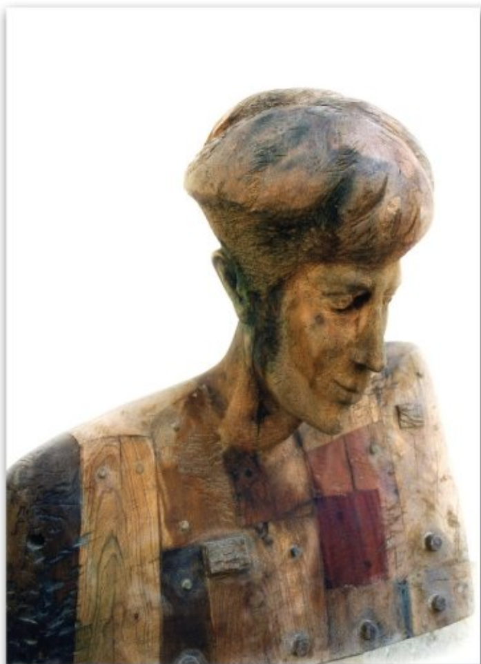
"IL POETA" (legno) cm 75x92 anni '80