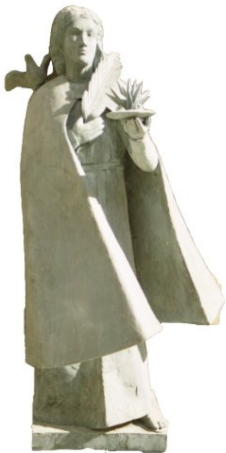
"SANTA LUCIA" (masonite-cartone) anno 2005