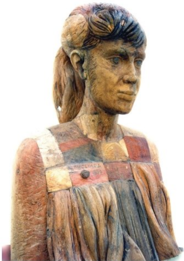
"BUSTO FEMMINILE" (legni diversi) cm 48x71 anni '90