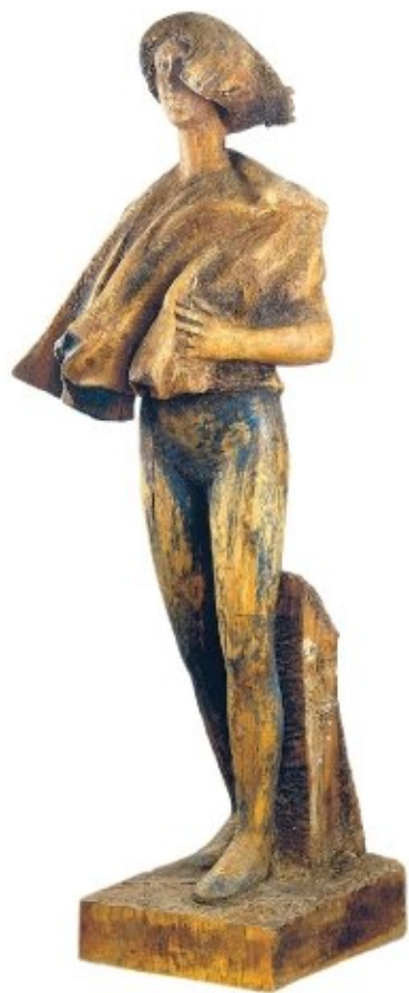
"TURISTA PER ORTIGIA" (legni diversi recuperati) anni '80