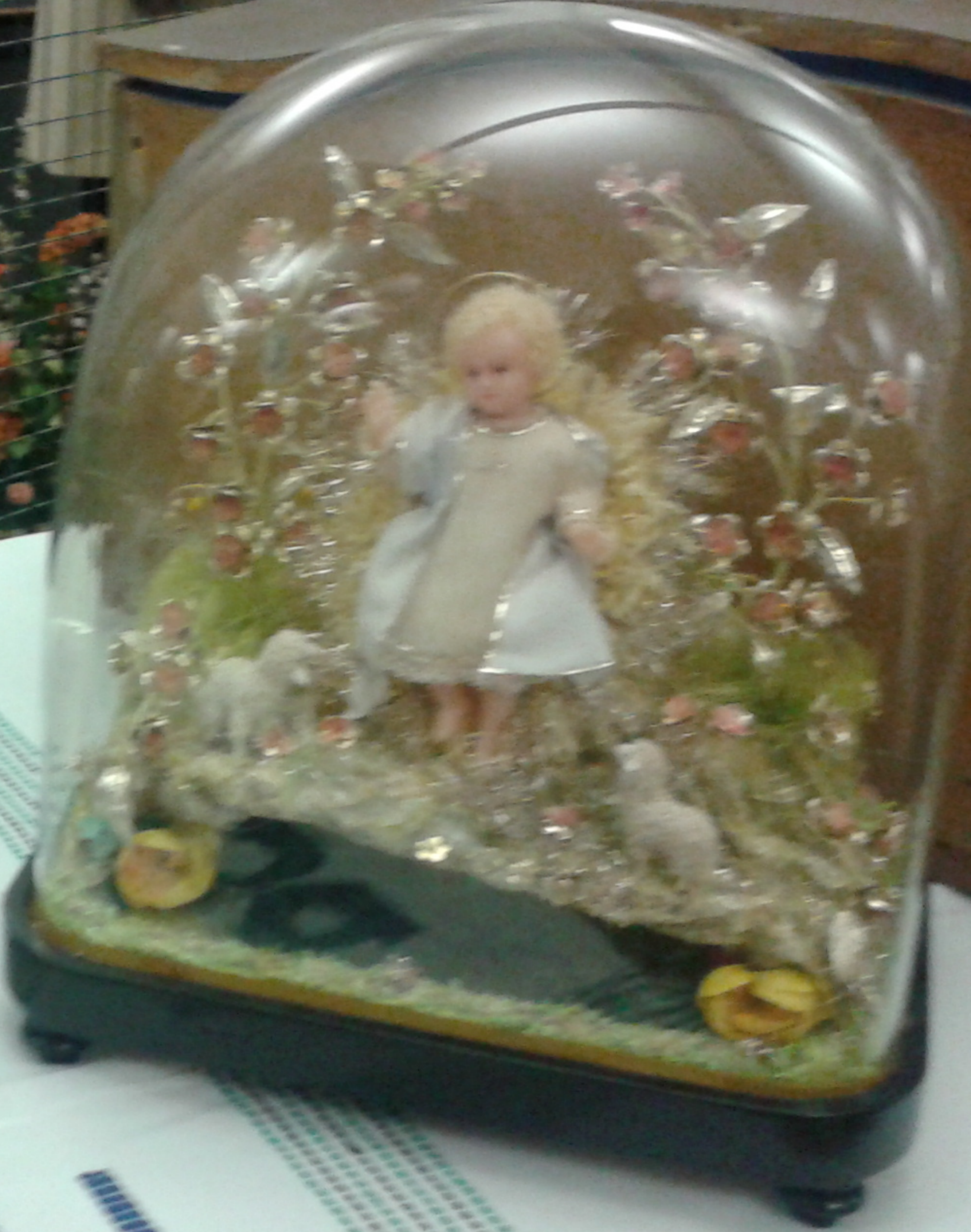
Museo di Firenze Espressioni del Natale del 1700 napoletano