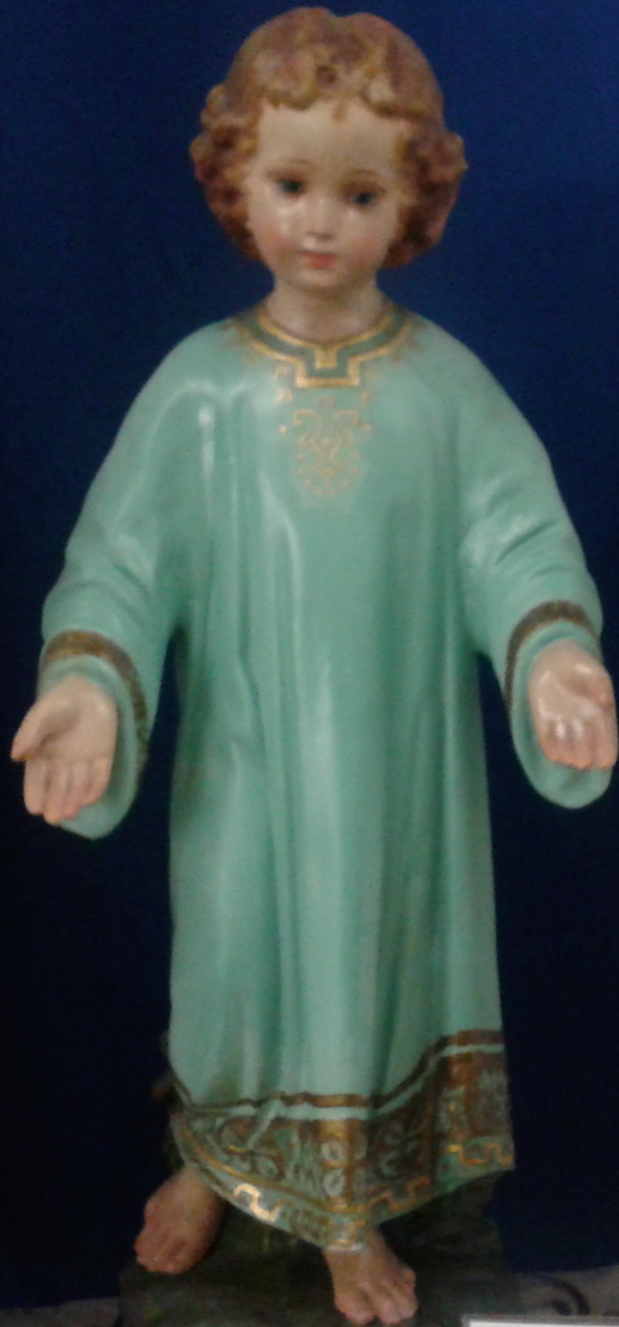
Mostra di Presepi NATILIZ 2014