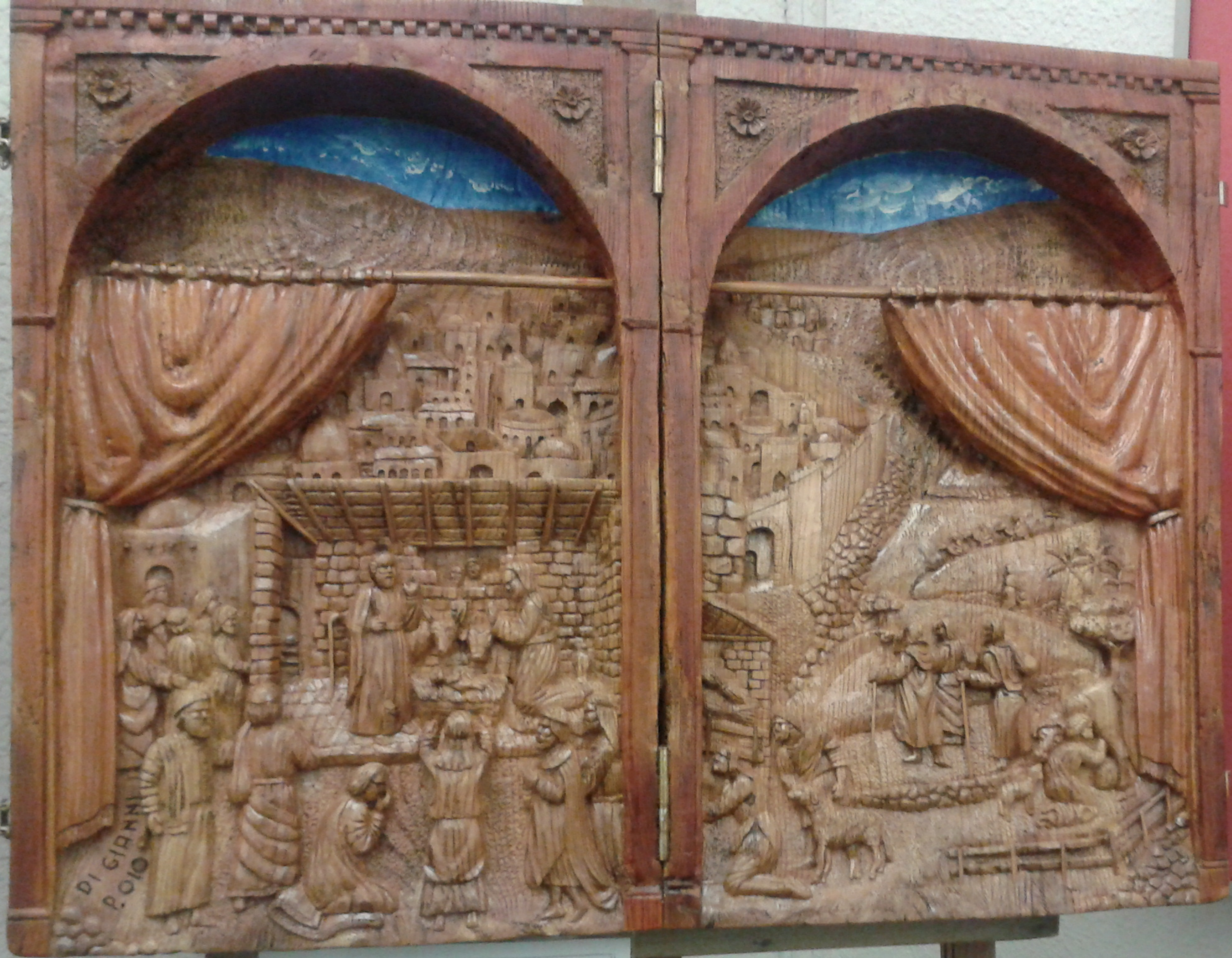
Mostra di Presepi NATALE 2014 Natale! Un vecchio tronco di abete! Ti ho visto, con sorpresa, uno splendido Presepe. Con lo scalpello l'ho portato alla luce perché tutti potessero ammirarlo Di Gianni Pasquale LABORATORIO UOMINI Oratorio Salesiano Michele Rua Torino