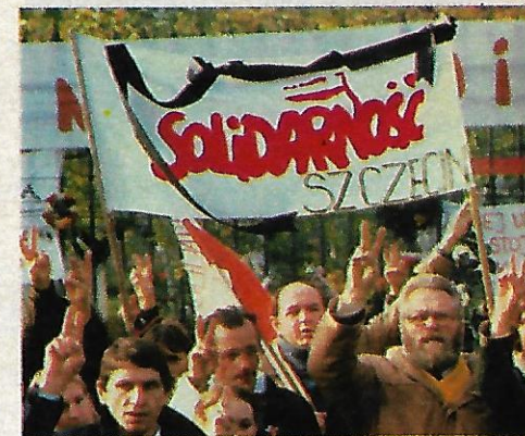
Sopra: padre Popieluszko davanti alla carta geografica della Polonia sulla quale aveva evidenziato le località dove si trovavano i campi di prigionia per attivisti di Solidarnosc. Sotto: cittadini polacchi in corteo innalzano la bandiera del sindacato.