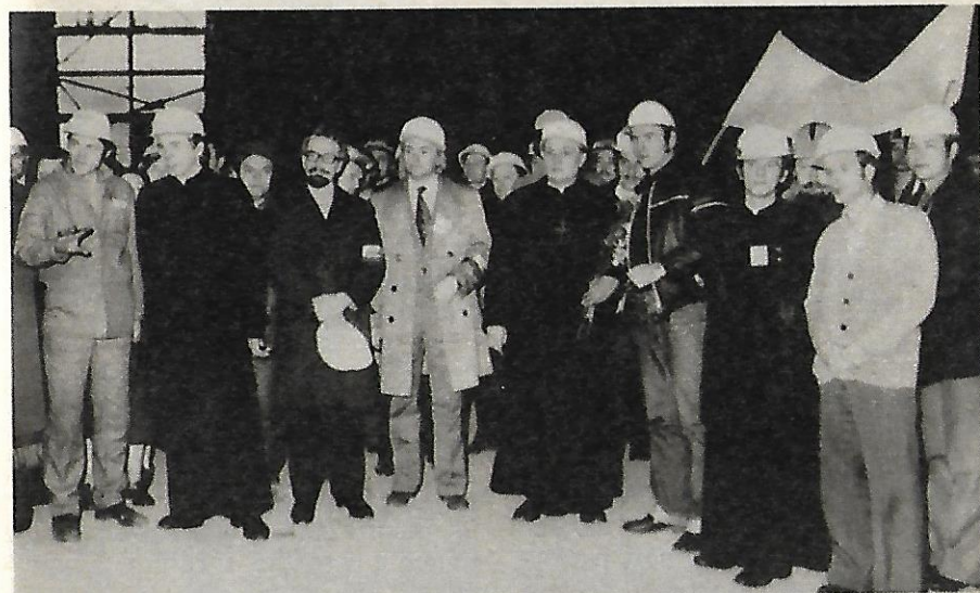
Padre Jerzy fotografato in mezzo ai suoi amati operai delle acciaierie.

co alle miniere di carbone della Slesia i lavoratori polacchi rimanevano compatti. A dispetto delle minacce del Cremlino era nato Solidarnosc («Solidarietà» in polacco). In quell'ultima domenica d'agosto del 1980 il popolo polacco aveva ottenuto una vittoria senza precedenti: il diritto a un sindacato libero e altre riforme di primaria importanza. Nell'ora vibrante del trionfo gli operai