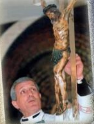
GIOVANNI PAOLO II Papa SANTO